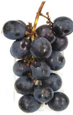
本物のブドウは単なるイメージです