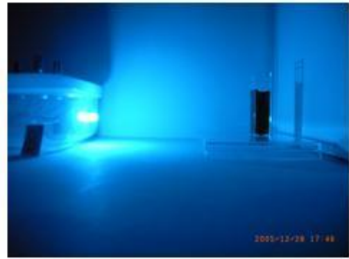
青い光を当てたとき