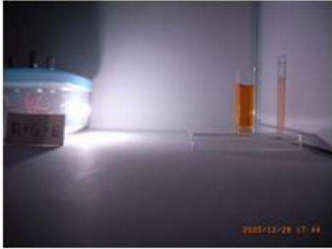
白い光を当てたとき