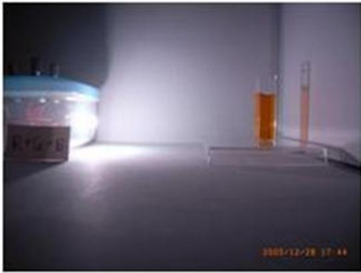
白い光を当てたとき