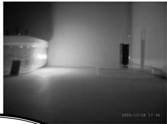
青い光を当てたとき