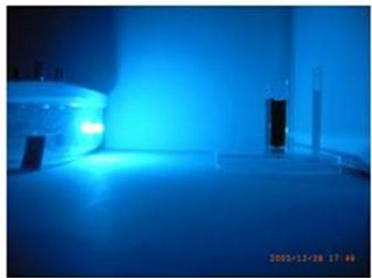
青い光を当てたとき