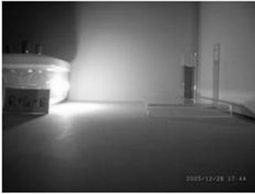
白い光を当てたとき