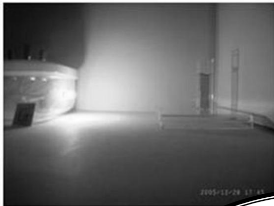
緑の光を当てたとき