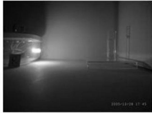
赤い光を当てたとき